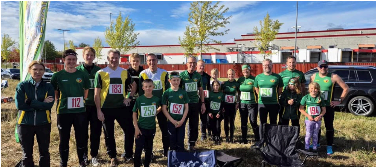
KOK ställde upp med 9 st 2-mannalag på DM i sprintstafett 2024 och vann H21-klassen.

I december kördes "Råhänget" vid Malmenbadet med totalt 11 deltagare från KOK och Vingåkers OK. Segrare på långa banan blev Ola. Elvin vann den korta banan tätt följd av Nora. Efter målgång bjöds de tävlande på bastu och julgröt i Siggetorp innan det var dags för planering av 2025.