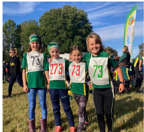
Glada KOK-ungdomar på Peking-Duon vid Löfstad slott utanför Norrköping och Stafett-DM i Kjula.